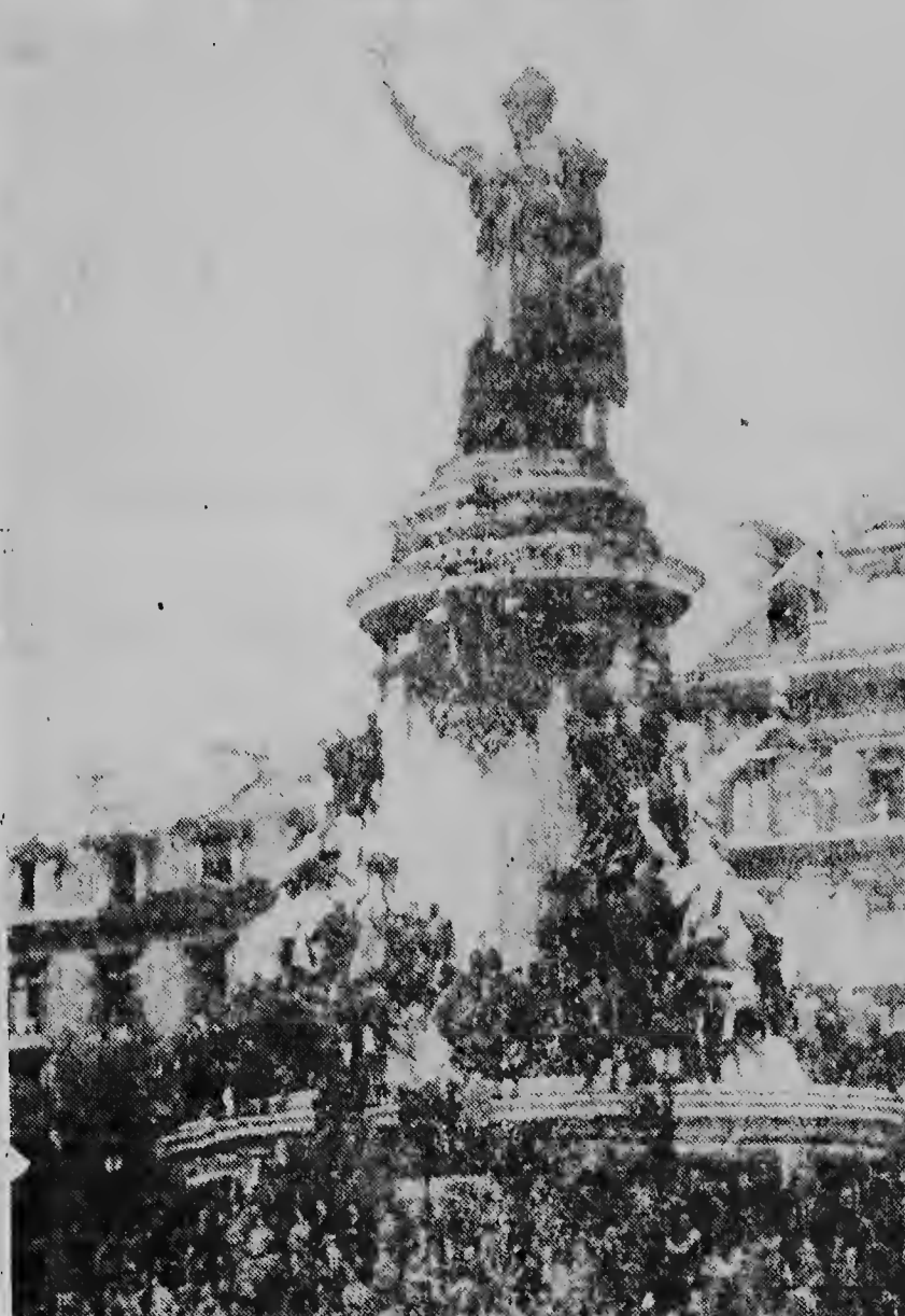
Enorme multitud di hende ta aglomera tanto riba como rond dje husto dje Republica riba Place de la Republika na Paris, ora cu a demonstra aya 200.000 habitantenan di Paris contra De Gaulle. Wel nan a carga tur divisanan i nan a cuminsa cu gritonan. Pero esakinan no a yega na incidentenan serio.

y si nan no hacie nan lo a worde declara proscribo.